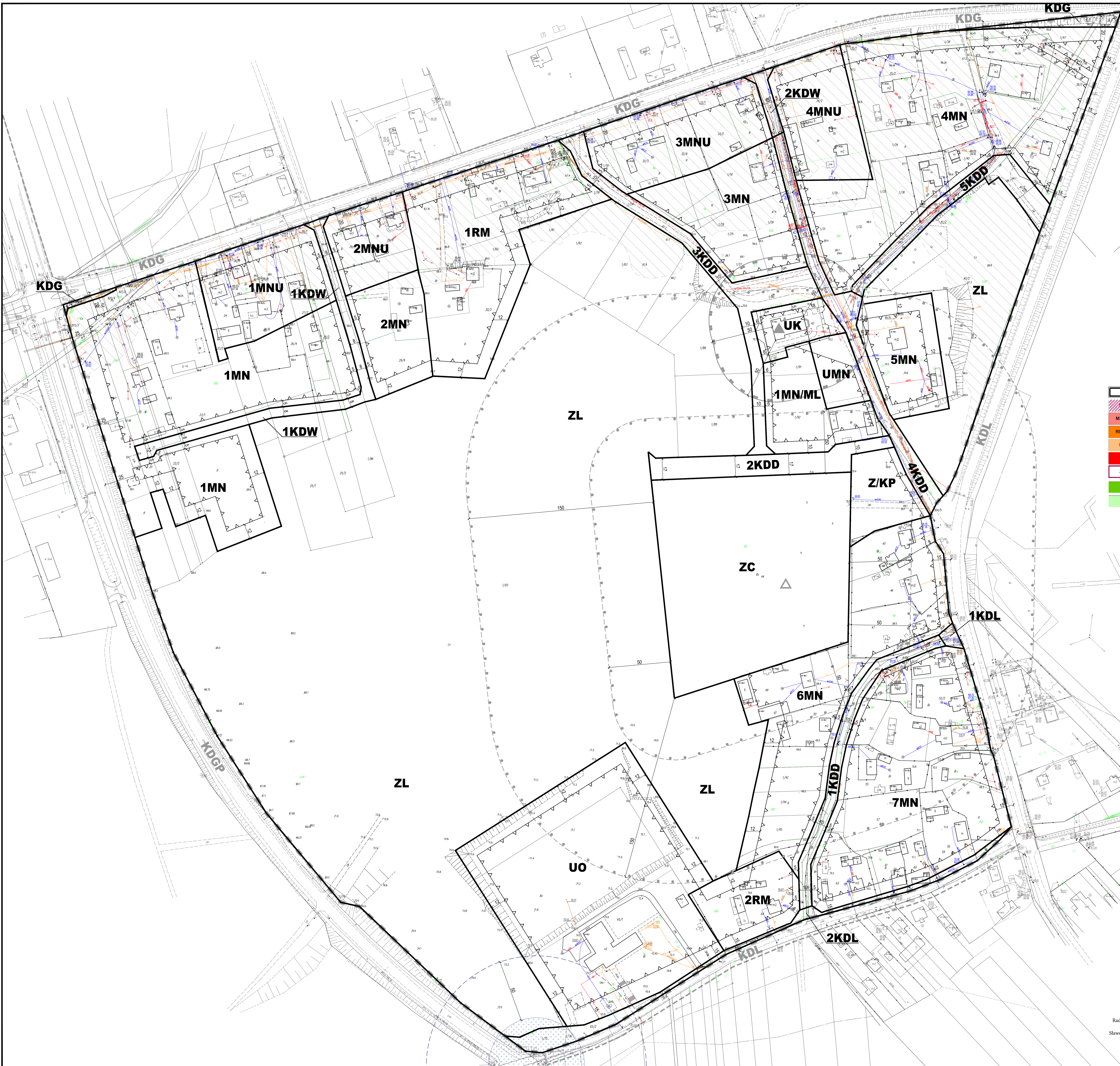
Wyrys ze Studium uwarunkowań i kierunków zagospodarowania przestrzennego gminy Młodzieszyn